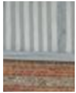
Mairie/ Ancien Presbytère