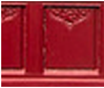
Magasin de jouet