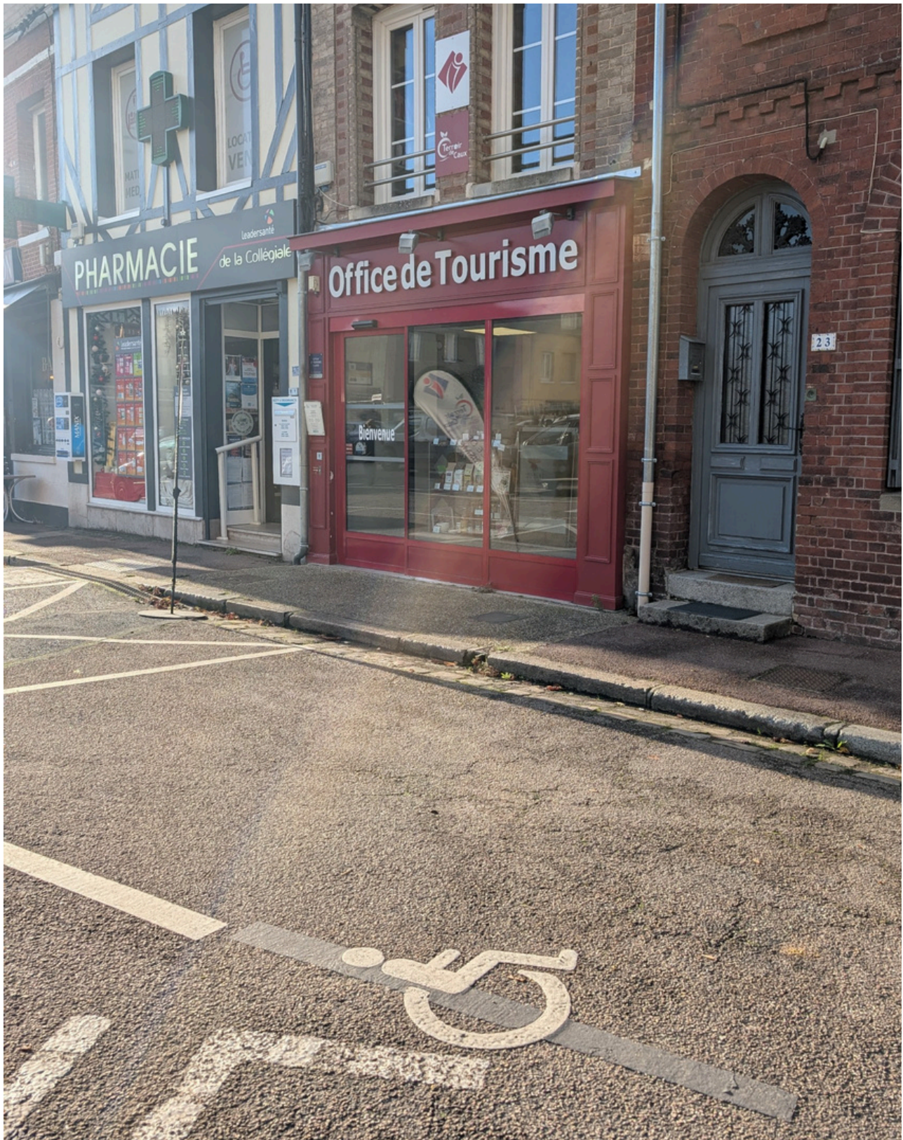
PHOTO DU STATIONNEMENT PERSONNES À MOBILITÉ RÉDUITE